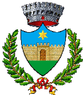
CHIUSA DI SAN MICHELE