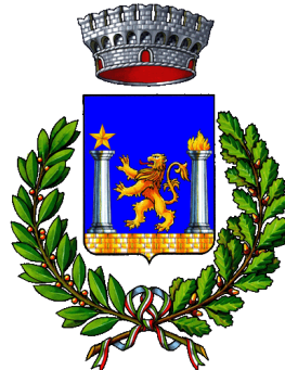
SANT'AMBROGIO DI TORINO